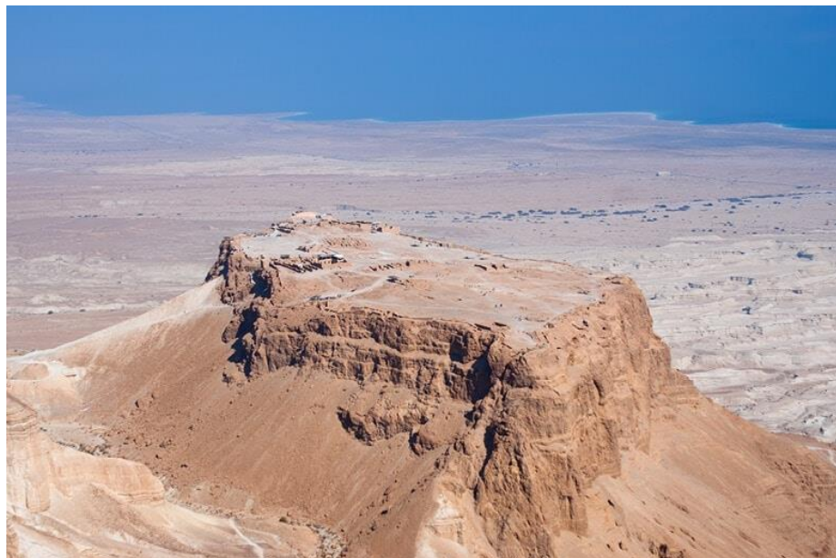
לא רק בטן-גב: אזור ים המלח מציע מגוון פעילויות מרתקות.

“זה נכון, אנחנו מתמודדים עם כל האתגרים שהתקופה הזו מביאה עלינו. אבל אתה רואה, אנחנו ממשיכים לפעול, לשווק, לקדם. ובין היתר, שיבואו הישראלים, יכירו מחדש את ים המלח ואת כל הדברים הטובים שקורים פה.”