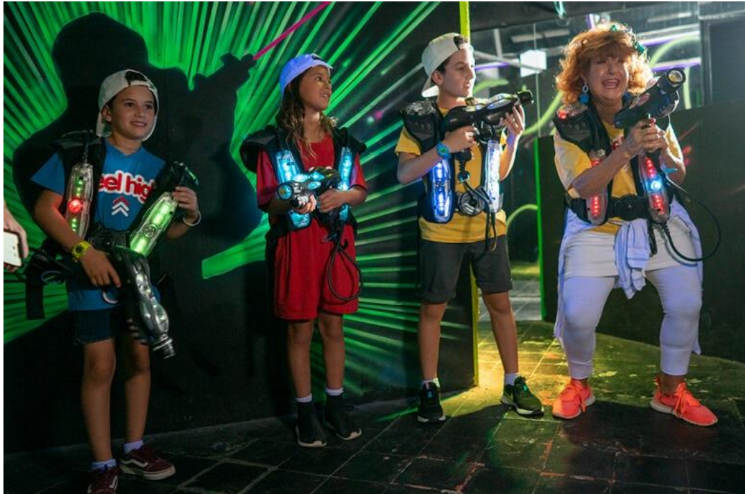
ים המלח: יותר ממה שציפיתי – Go low, Feel high.

אני ממש מעריך את הזמן שלקחת לענות לנו על כל השאלות. עוד משהו קטן לפני שאנחנו מסיימים. יש איזו נקודה מיוחדת בשבילך בים המלח? משהו שאתה היית ממליץ עליו אישית? פעילות, אטרקציה או מקום כלשהו?