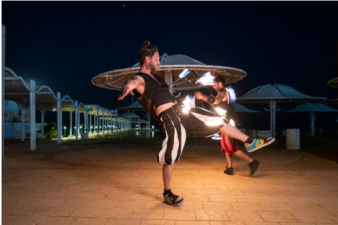
פסטיבל מרהיב במקום הנמוך בעולם עם מגוון דמויות וקולנוע אורבני.