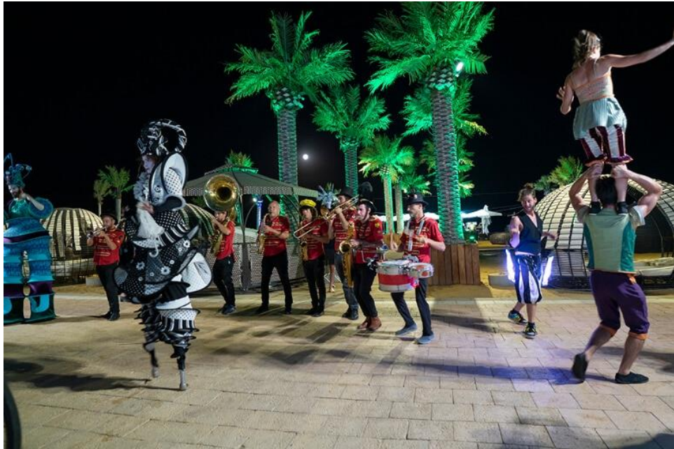
במהלך הפסטיבל תהיה תהלוכת תזמורת צבעונית וסגונית לאורך הטיילת.