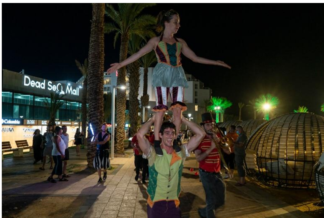
"מאירים את הטיילת": פעילויות מרהיבות תחת כיפת השמיים.

"בנוסף לזה, אנחנו עושים את פרויקט "מאירים את הטיילת", שבו אנחנו מציעים מגוון פעילויות: פעילויות לילדים, הקרנות של סרטים, מיצגים ובובות מתנפחות, וכל מיני פעולות על החוף. הכול פתוח, תחת כיפת השמיים – וללא תשלום. אלו הפעולות שהמועצה עושה ומקדמת על הדברים הקיימים במשך כל השנה, אבל גם עכשיו, במיוחד לקיץ למשפחות ולילדים. יש לייזר טג, יש פה רייזרים וטרקטורונים, קורקינטים, אפשר לשכור אופניים ולטייל. ים המלח זה לא מה שהיה פעם."