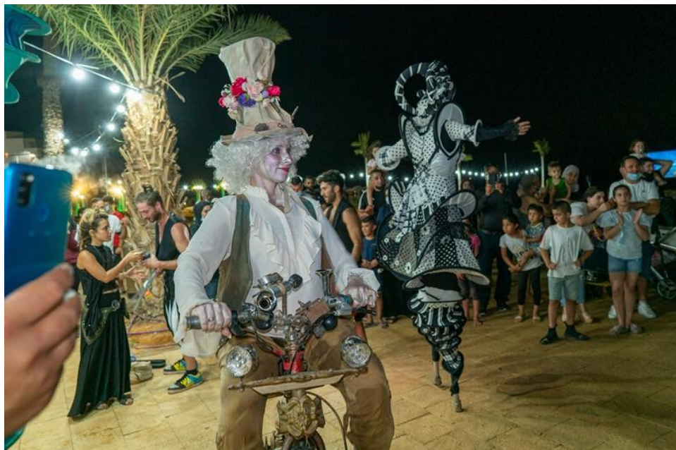
ממגון דמויות שטח צבעוניות ואמני קרקס מלהיבים שיסתובבו ברחבי הטיילת.

בין ריקודים לצילי תזמורת לצפייה בסרטים באוויר הפתוח, תוכלו להינות ממגון דמויות שטח צבעוניות ואמני קרקס מלהיבים שיסתובבו ברחבי הטיילת וייצרו מופעי אומנות מרהיבים. שילוב בין דמויות אותנטיות שיספרו את הסיפור של ים המלח לצד דמויות סגוניות ומרהיבות. דמויות שטח, הולכי קביים, מופעי אש בשילוב ריקוד, מופעי אקרובלאנס סגוניים, להטוטנים ועוד שיצבעו את האירוע ויעניקו לכם חווית בידור יוצאת דופן.